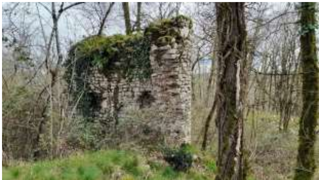
Chapelle Sainte Marie Madeleine

Au lieu-dit « La Chambrésie, entre les villages de la Raymondie et de la Forêt, sur une petite colline nommée le Pech de l'Eglise par les anciens, il reste quelques pans de murs et tas de pierres d'une chapelle qui portait le nom de Sainte Marie Madeleine de Chambrazès.