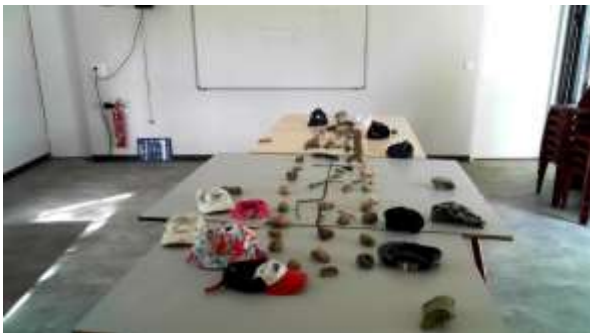
Course de casquettes en stop motion

Nous avons construit un zootrope ou un thaumatrope. Puis nous avons fait du stop motion : on a pris plusieurs photos en bougeant les objets un petit peu à chaque fois. A la fin, ça a fait une vidéo qui dure quelques secondes.