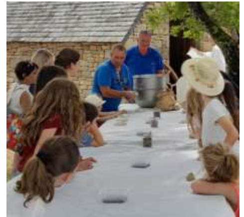
Les enfants ont fabriqué des boules de pain qu'ils ont rapportées chez eux ou dégustées sur place !

Vendredi 23 juin 2023 : buvette et tapas lors du spectacle de fin d'année. Tombola avec de nombreux lots à gagner !