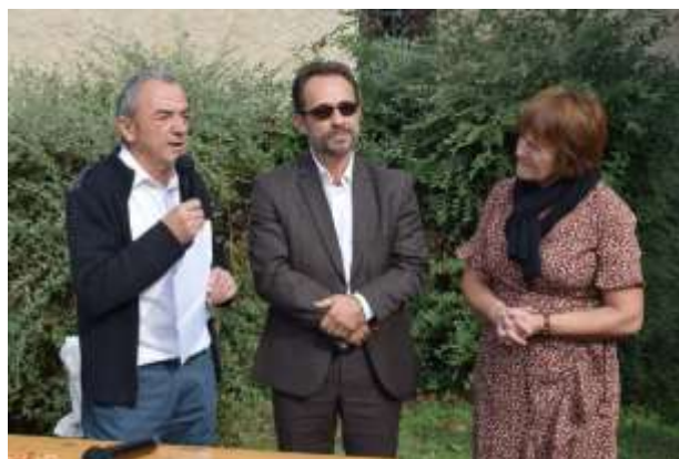
Discours d'inauguration du salon