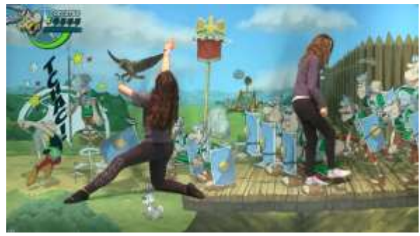
La réalisation finale avec le fond ajouté