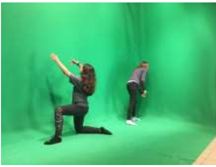
Le tournage sur fond vert