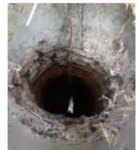
Puits des Anglais

D'après la tradition, la chapelle de Chambrazès aurait été détruite par les anglais durant la guerre de Cent Ans mais le prieuré est encore cité en 1791.