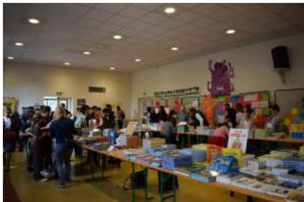
Dédicaces lors du salon du livre du 8 octobre 2022

Merci à la Mairie, aux parents d'élèves et aux dames de « Bien vivre à Nadaillac » pour leur aide.