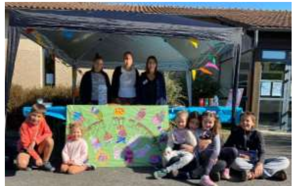
Nos stands de gâteaux ont toujours du succès !

Octobre-novembre 2022 : vente de chocolats de Noël.