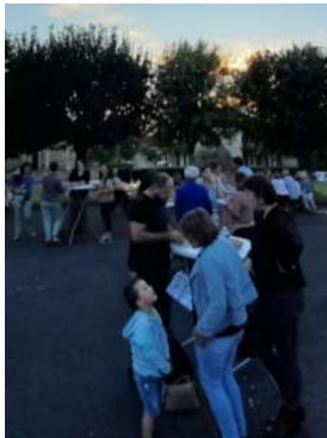
Soirée tapas qui a clôturé la fête de fin d'année scolaire ! (juin 2022)

Vendredi 23 juin 2023 : buvette et tapas lors du spectacle de fin d'année. Tombola avec de nombreux lots à gagner !