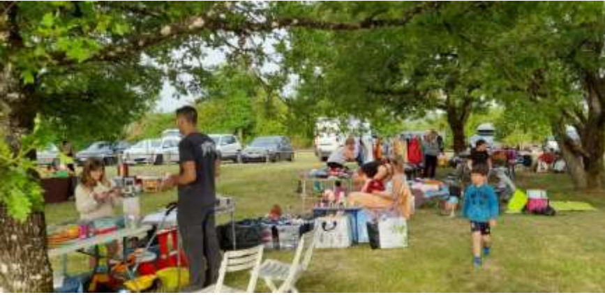
Vite Ta Chambre (mai 2022)