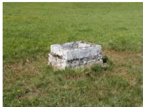
Puits des Ferraux